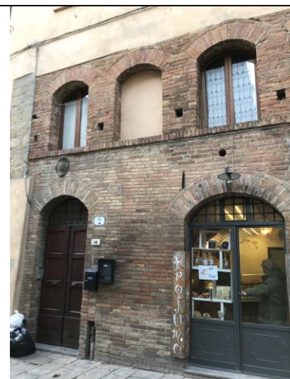
Volterra Casa Fiascai